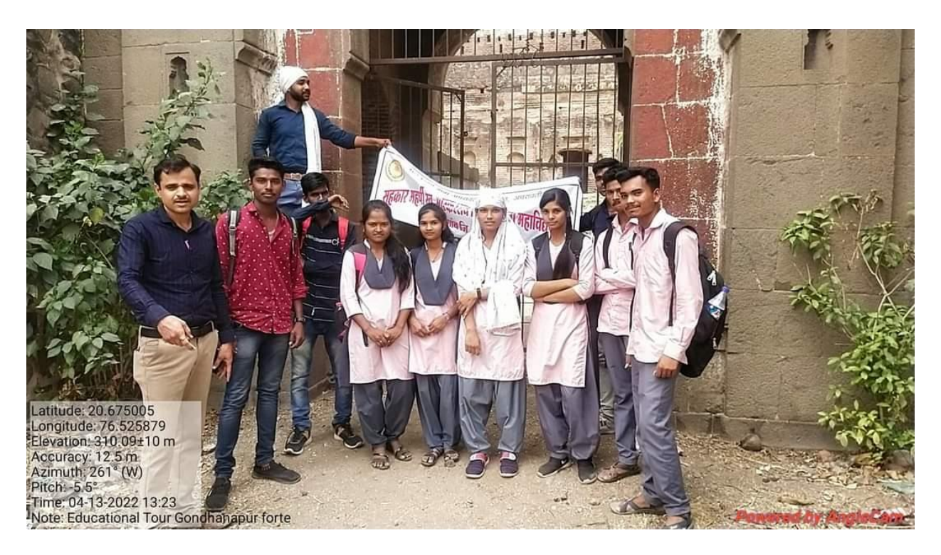
Visit to historical place of Gondhnapur Fort on 13 April 2022