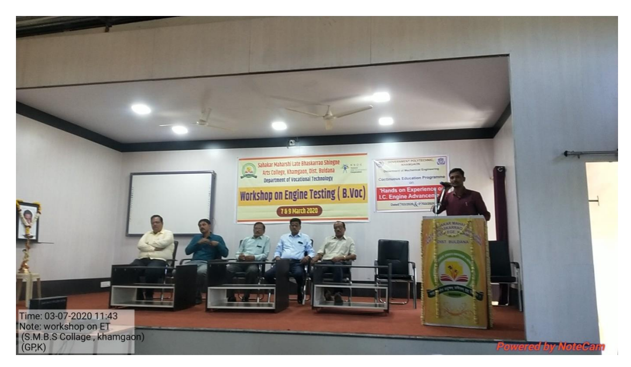
Criteria 3- Research, Innovations and Extension