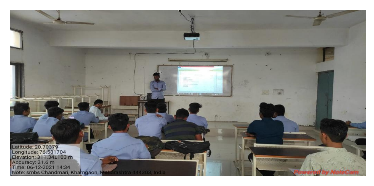
Seminar Presentation for Final Year Students Batch 2021-22