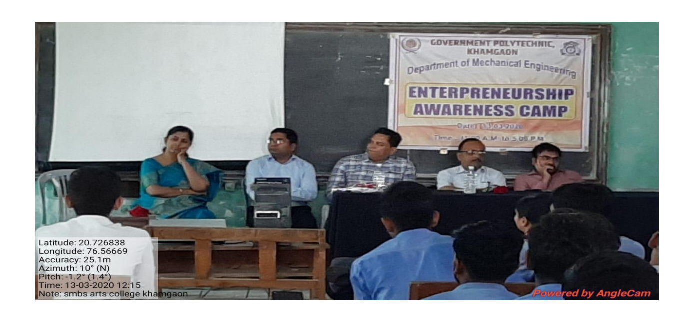
Entrepreneurship Awareness Camp at Government Polytechnic, Khamgaon