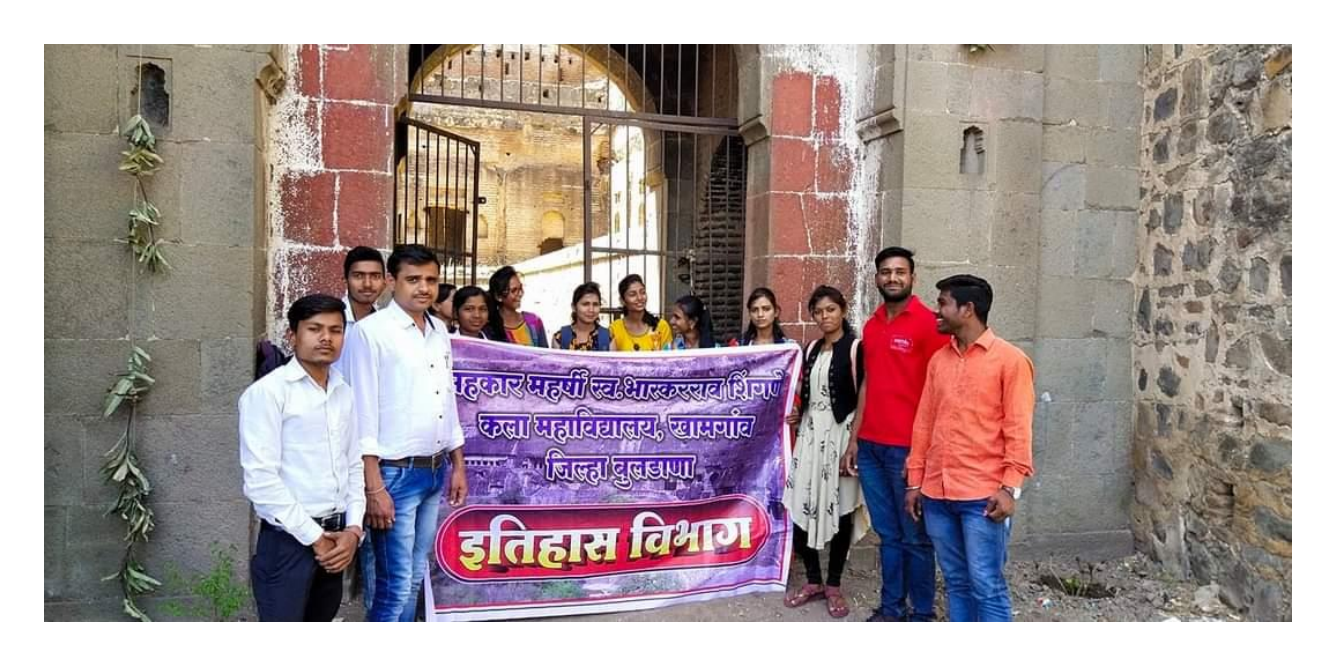
Visit to historical place of Gondhnapur Fort on 7 March 2020