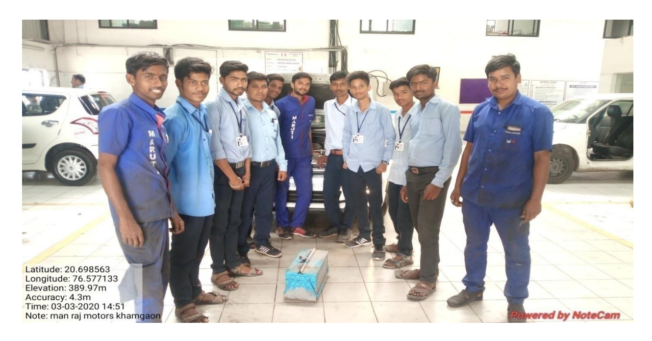
Industrial Visit of students to Manraj Motors, Khamgaon