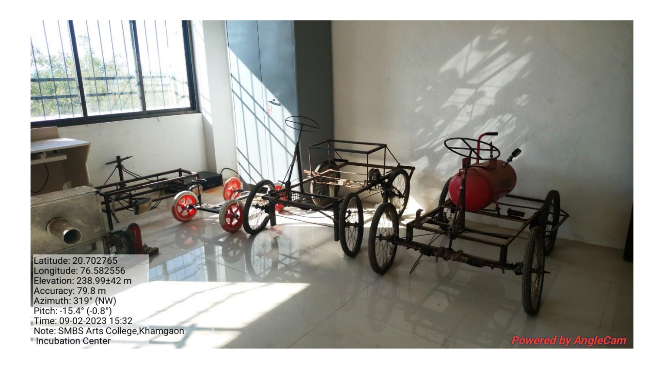
Innovation and Incubation Centre in the college