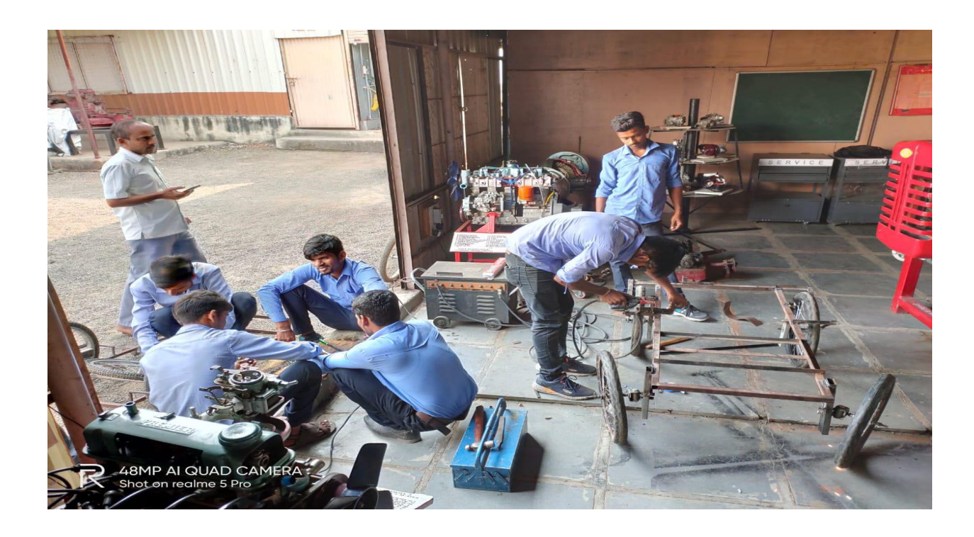
Project Fabrication of Final Year Students at College Workshop