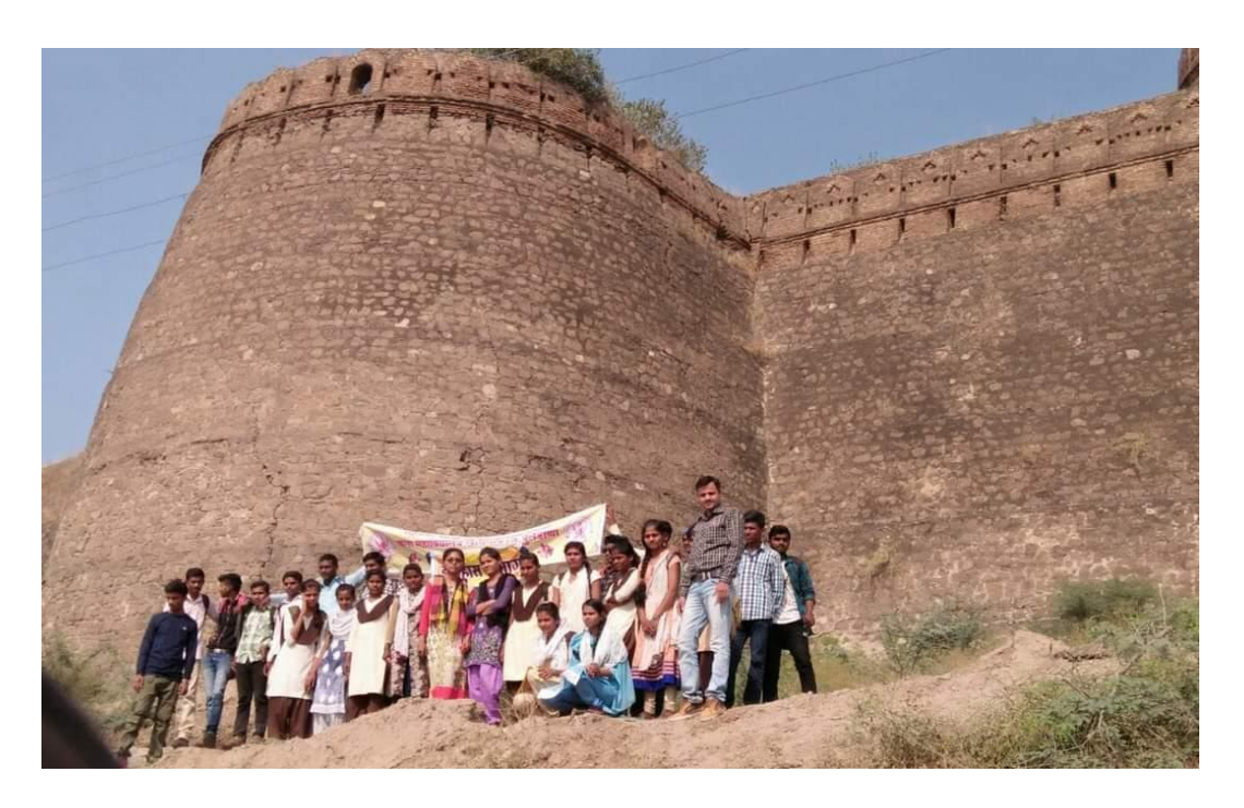
Department of History visit to historical place Balapur Fort on 16 November 2017