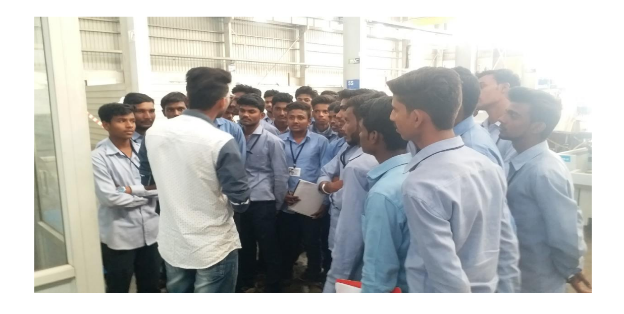
Industrial Visit at Marathwada Auto Cluster, Aurangabad