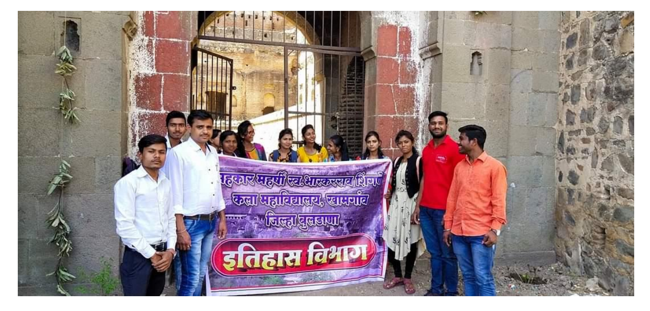
Visit to historical place of Gondhnapur Fort on 7 March 2020