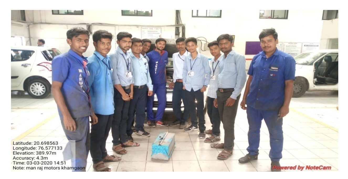
Industrial Visit of students to Manraj Motors, Khamgaon