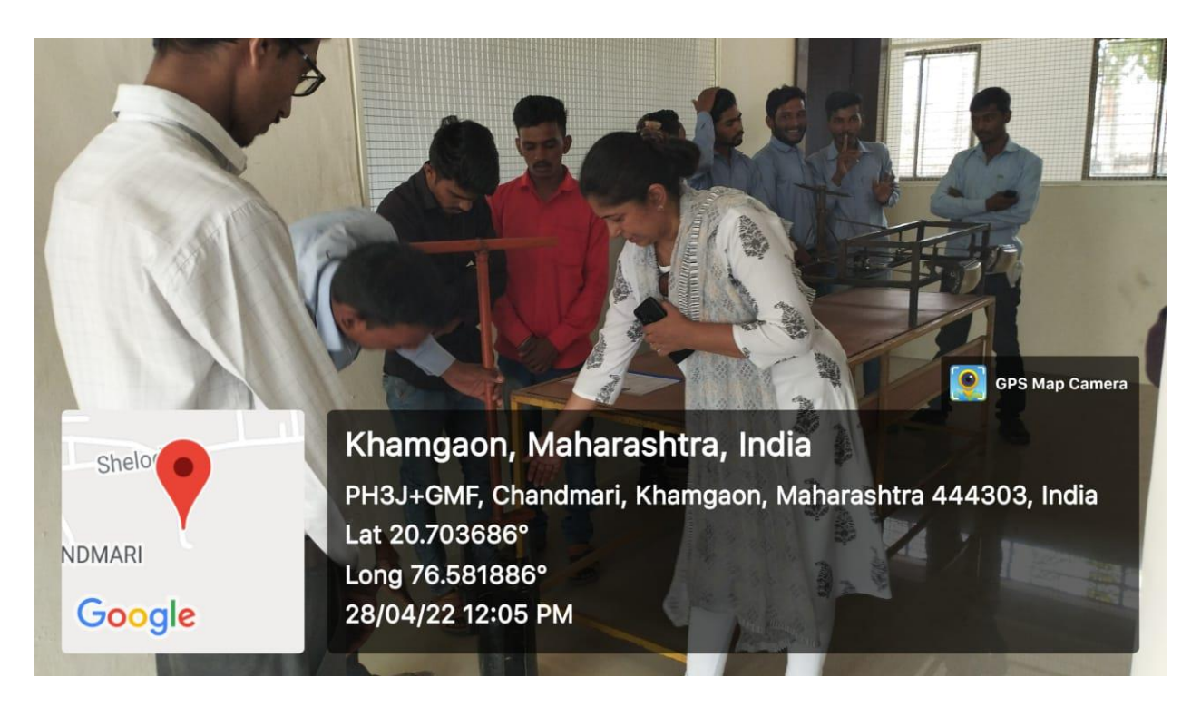
B.Voc Final Year Students presenting project