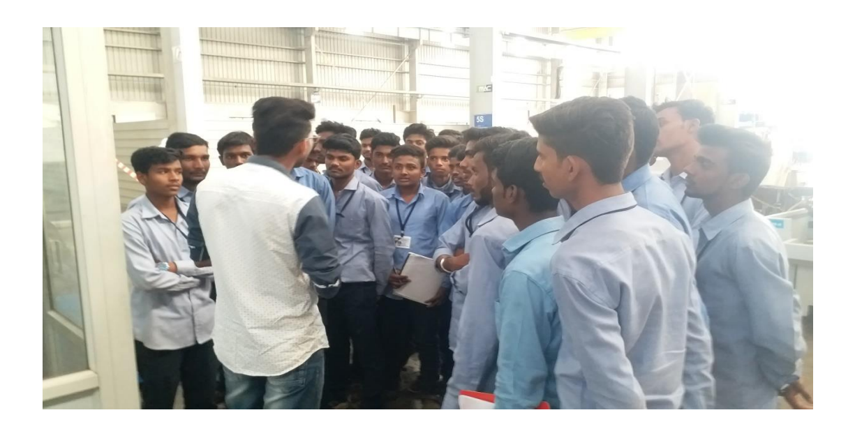
Industrial Visit at Marathwada Auto Cluster, Aurangabad