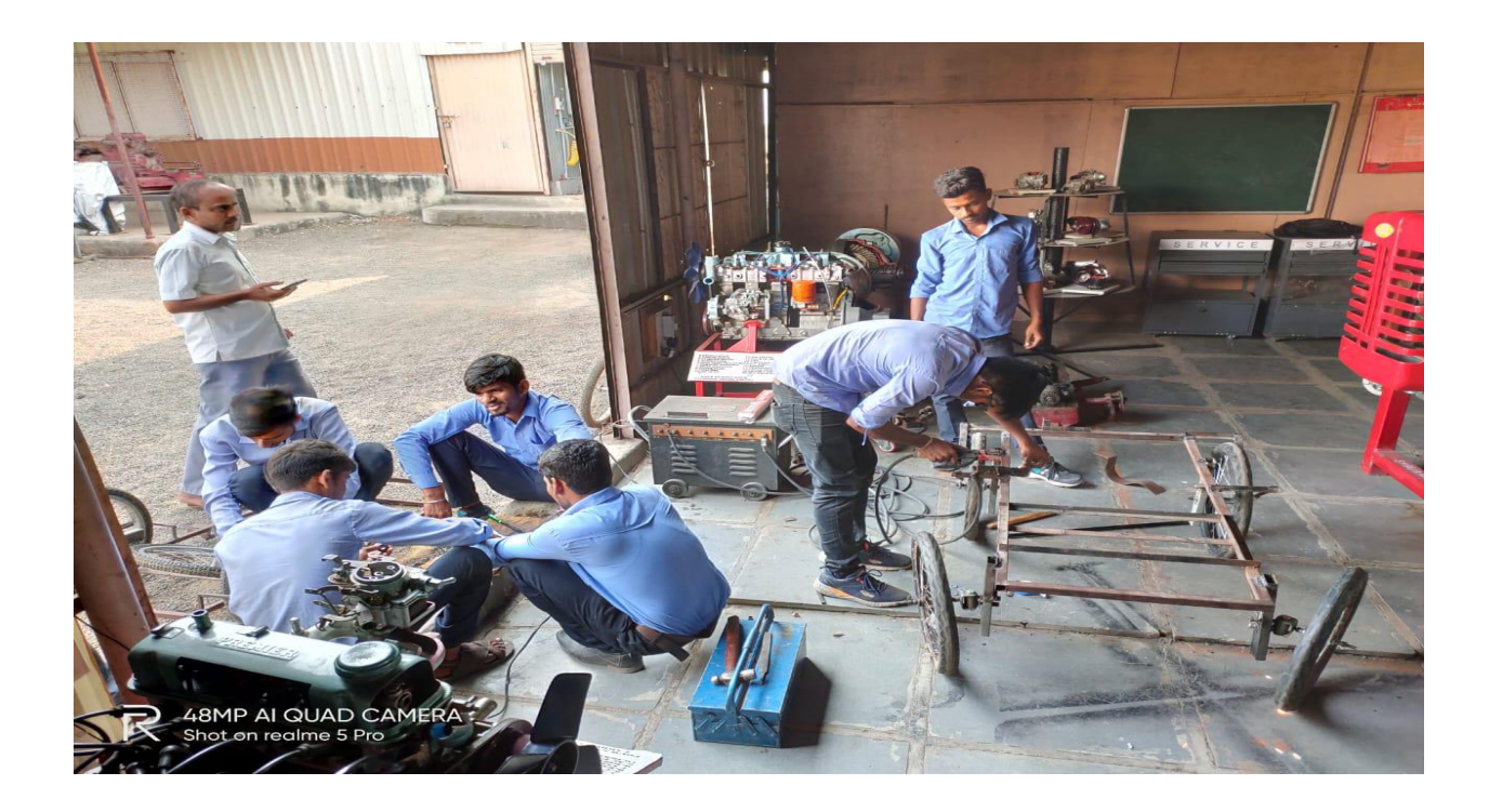
Project Fabrication of Final Year Students at College Workshop