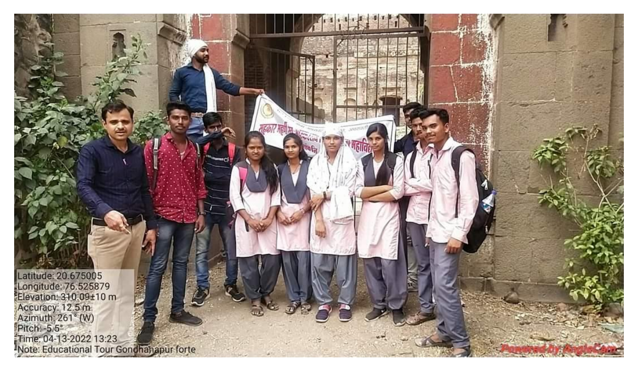
Visit to historical place of Gondhnapur Fort on 13 April 2022